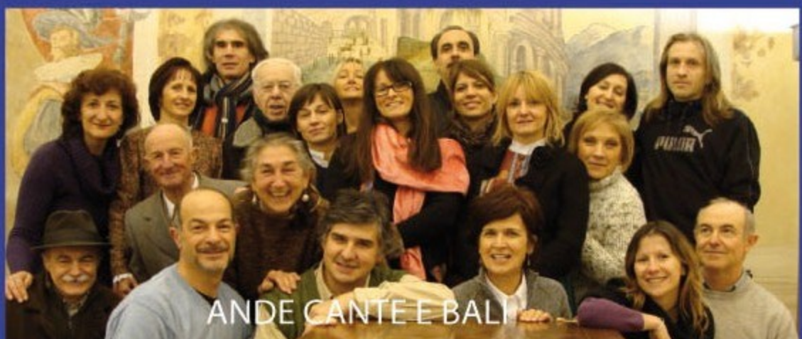
ANDE CANTEE BALI